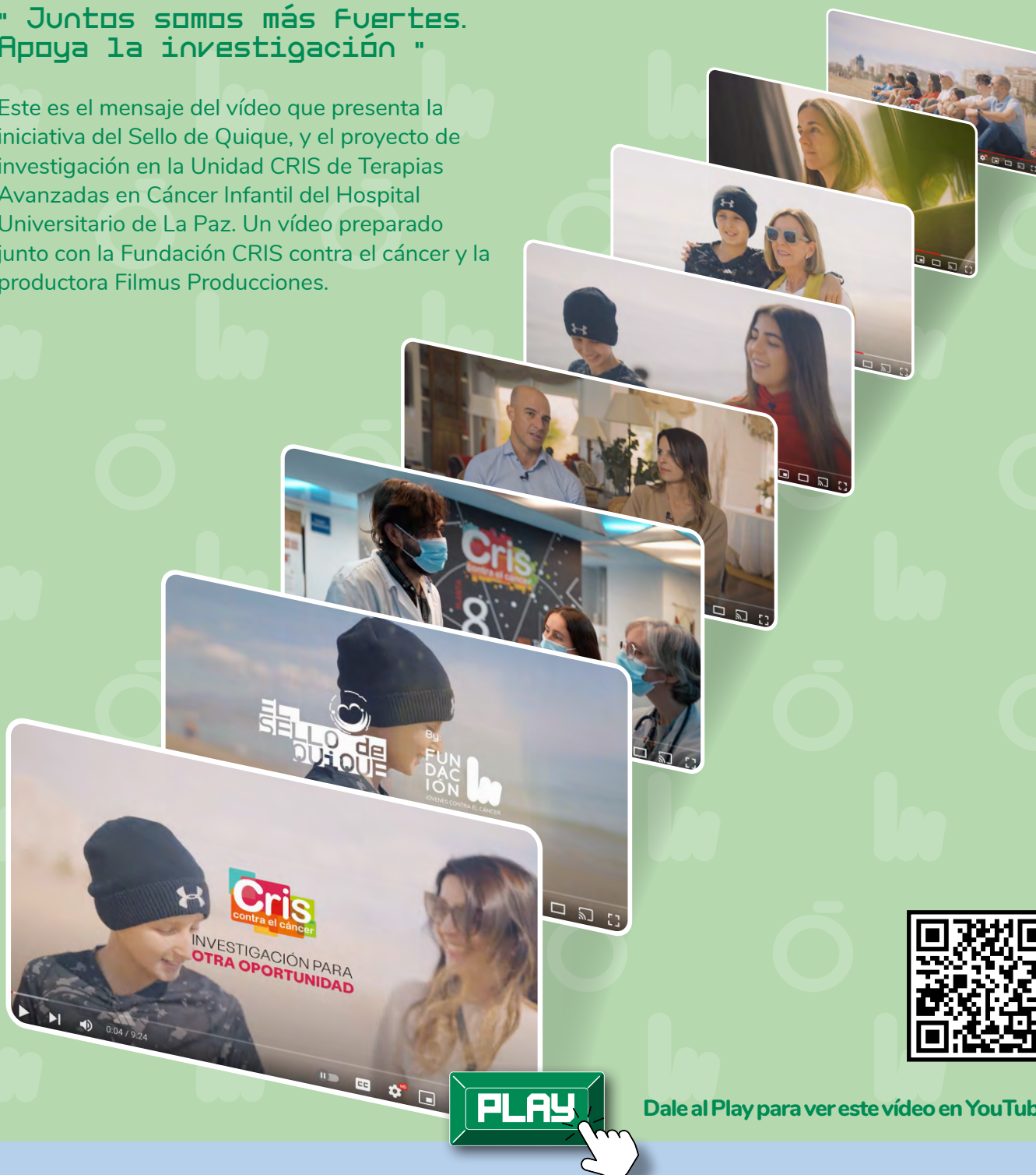
9- Imágenes del vídeo promocional presentando la iniciativa de 'El Sello de Quique'.

Este es el mensaje del vídeo que presenta la iniciativa del Sello de Quique, y el proyecto de investigación en la Unidad CRIS de Terapias Avanzadas en Cáncer Infantil del Hospital Universitario de La Paz. Un vídeo preparado junto con la Fundación CRIS contra el cáncer y la productora Filmus Producciones.